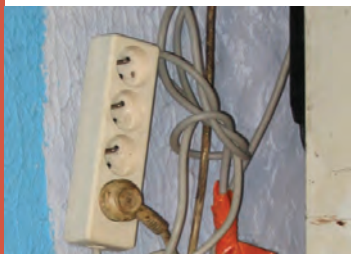
Installation électrique dangereuse