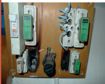
Branchements d'électricité vétustes

Les dispositifs de retenue des personnes, dans le logement et ses accès, tels que garde-corps des fenêtres, escaliers, loggias et balcons, sont dans un état conforme à leur usage.