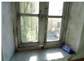
Menuiserie non étanche

La nature et l'état de conservation et d'entretien des matériaux de construction, des canalisations et des revêtements du logement ne présentent pas de risques manifestes pour la santé et la sécurité physique.