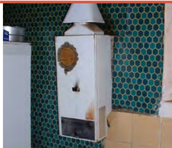
Absence de dispositif d'évacuation des gaz brûlés

Des installations d'évacuation des eaux ménagères et des eaux-vannes empêchant le refoulement des odeurs et des effluents et munies de siphon.