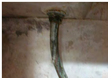
Absence de siphon

Une cuisine ou un coin cuisine permettant d'utiliser un appareil de cuisson et comprenant un évier alimenté en eau chaude et froide et raccordé à une installation d'évacuation des eaux usées. L'eau dans le logement doit être potable.