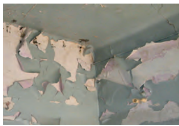
Peinture écaillée contenant du plomb

La lutte contre le saturnisme est de la compétence de l'ARS