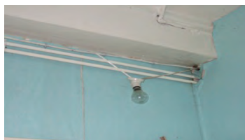
Eclairage insuffisant et dangereux