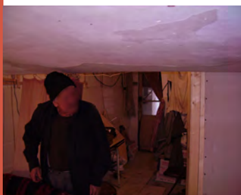
Hauteur sous plafond insuffisante

Un réseau électrique permettant le fonctionnement des appareils indispensables au quotidien.