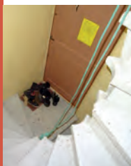
Absence de dispositifs de retenue des personnes

Le logement assure le clos et le couvert. Le gros œuvre du logement et de ses accès est en bon état d'entretien et de solidité et protège les locaux contre les eaux de ruissellement et les remontées d'eau. Les menuiseries extérieures et la couverture avec ses raccords et accessoires assurent la protection contre les infiltrations d'eau dans l'habitation.