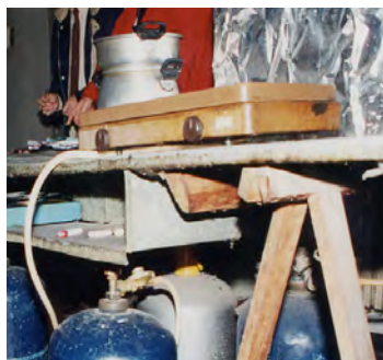
Coin cuisine de "fortune" hors norme et dangereux