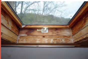
Absence de protection contre les infiltrations d'eau