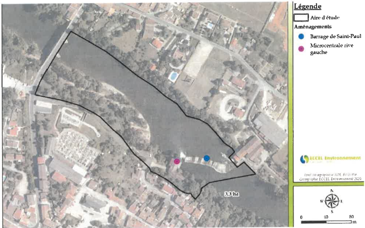
Figure 2 : Aire d'étude de référence pour la réalisation de l'étude d'impact issue de l'étude d'impact