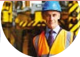
Technicien en hygiène et sécurité