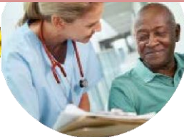
Infirmier santé travail